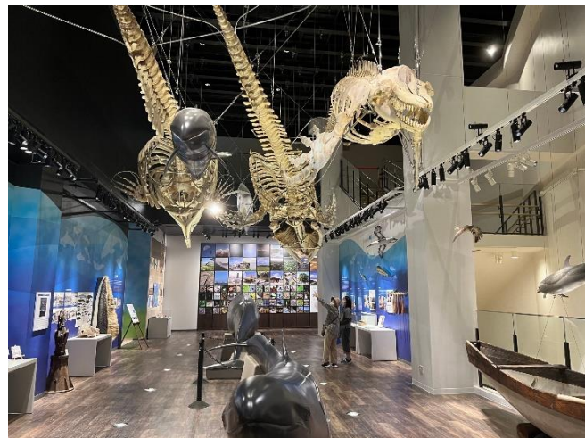
ザトウクジラやマッコウクジラ等

漁をする船はタンクブニと言って、戦後の物資が極度に不足したとき、比較的高価なサバニにかわって、タンクブニの出現だったみたいです。タンクブニは、米軍の戦闘機の燃料タンクを舟に改造していたみたいです。そのころは、生活に必要なものを得るためにみんないろいろな知恵をはたらかせたのだと歴史を感じました。