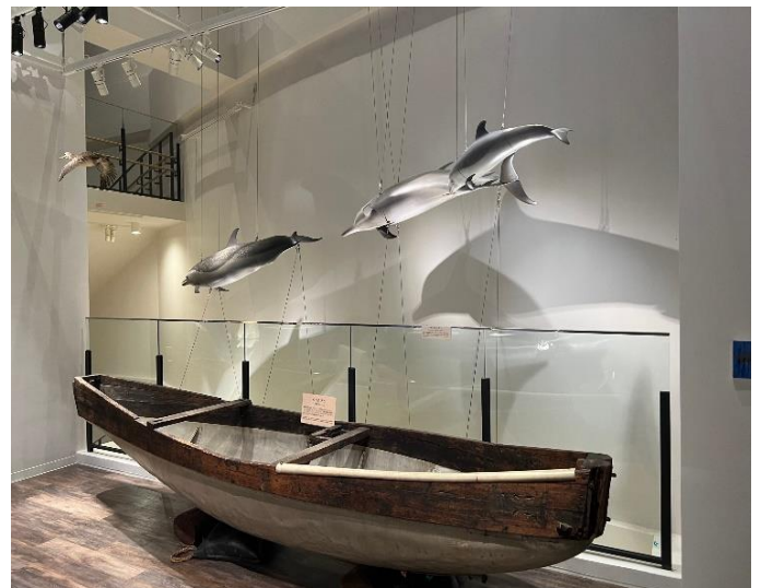
タンクブニとひーとうー