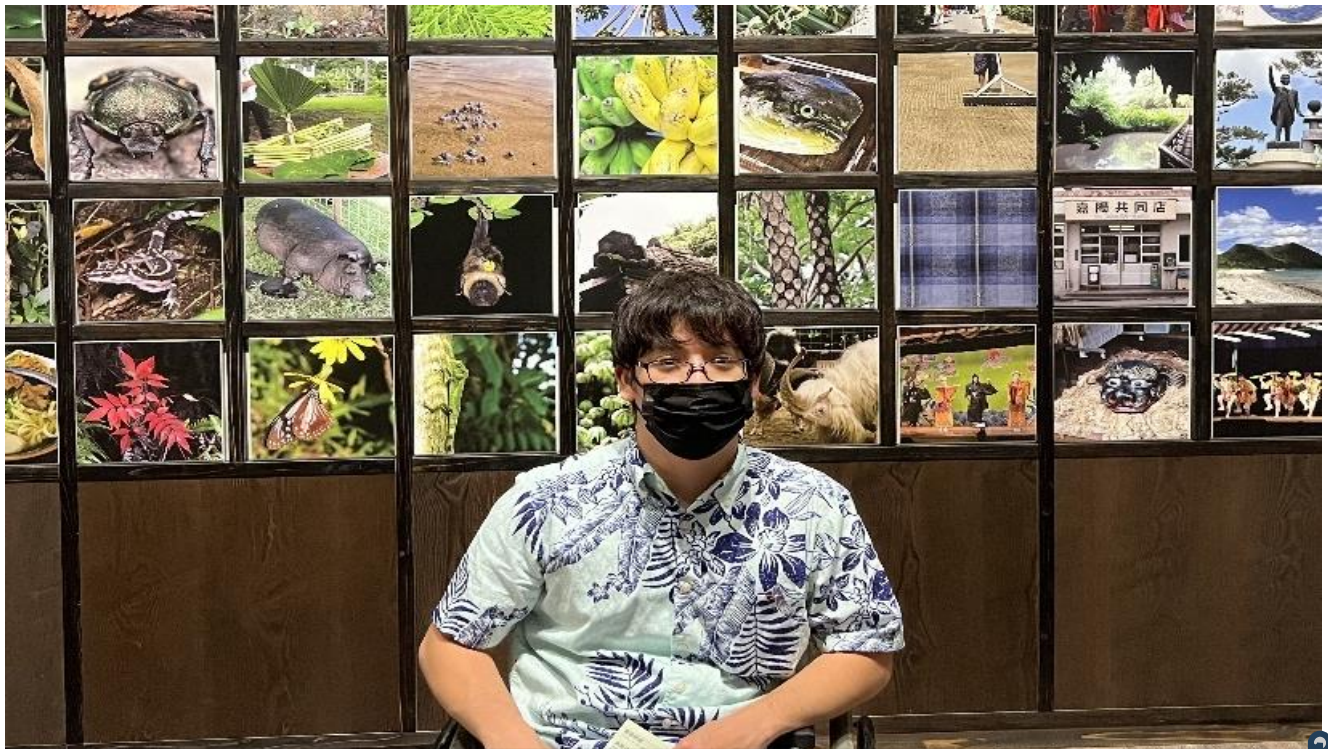
なごはくぶつかんとしゃしん 名護博物館で撮った写真！