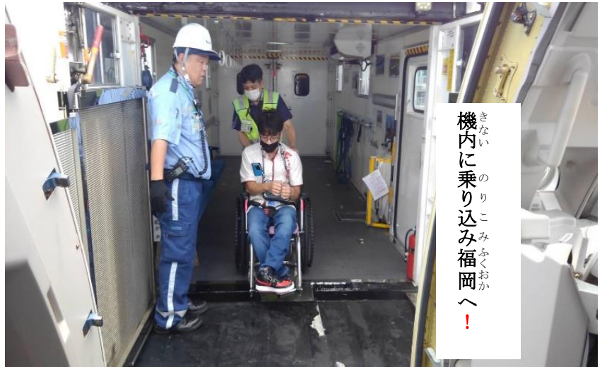
機内にも乗り込み福岡へ！

センターとしては、同じ目標に向かって取り組むことができる仲間を増やすことが大切だと思いました。後継者問題については、代表が元気なうちに仕事に関係する、マニュアル作成をしておくのも一つの方法だと感じました！