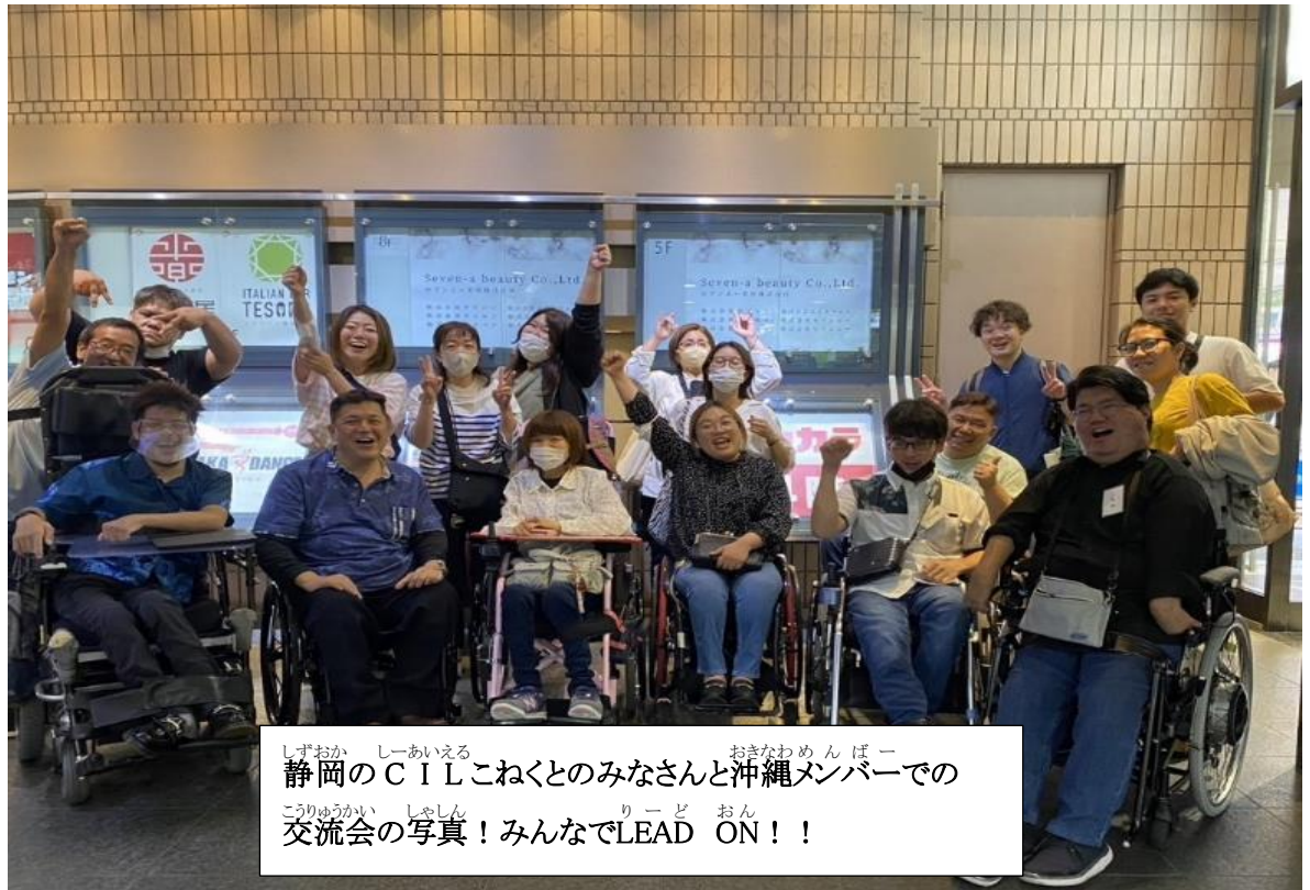
静岡のCILこねくとのおみなさんと沖縄メンバーでの交流会の写真！みんなでLEAD ON！！

たくさんの仲間からパワーをもらったので、沖縄に帰ったら、自分が出来る活動の一つずつ頑張ります！(*~*)