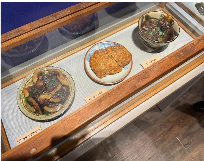
3種. 左から、ひーとうーいりちやー フライ、ひーとうー汁

まず、名護には古くから捕鯨文化があり、外海から訪れるピトゥの群れを名護湾の浅瀬に追い込む「ピトゥ漁」はかつて名護の風物詩でした。この漁にはウミンチュ(海人)だけでなく住民も総出で参加し、参加者には肉の分け前があり、また、ピトゥ漁の技術を活かして、1950~60年代にザトウクジラを主とする大型種の捕鯨も行っていました。肉類が高価だった時代、鯨肉は重要なタンパク源になっていたみたいです。