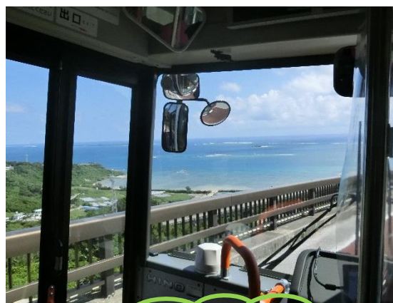
車内から見える綺麗な海！