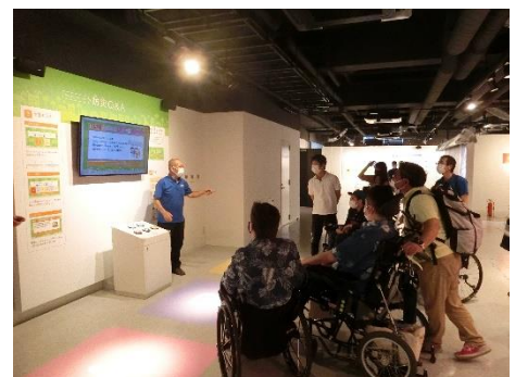
説明を聞いているところ