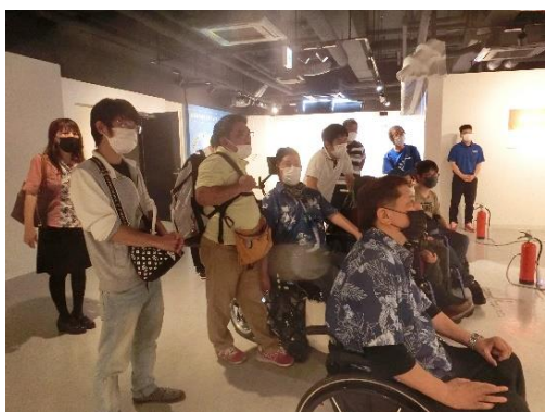
説明を聞いているところ