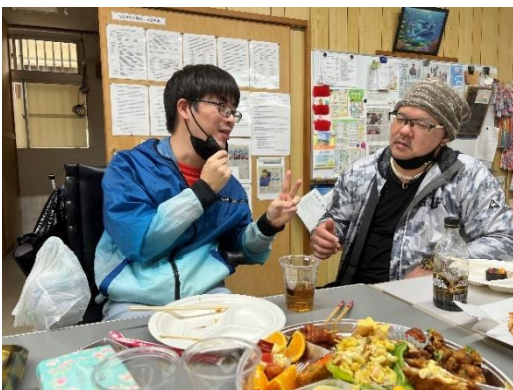
きららぼうねんかい 希輝々の忘年会♪

今回の企画で気軽にスタッフや利用者ともユンタクー(おしゃべり)が出来て、お腹いっぱい食べて、免疫力も十分についたかと思えます。後、それぞれの一年の課題や良かったところ、来年の希望や抱負を一言ずつ語ってもらいました。今年是对面で皆さんとお会いし、たくさんユンタクー(おしゃべり)したいです。