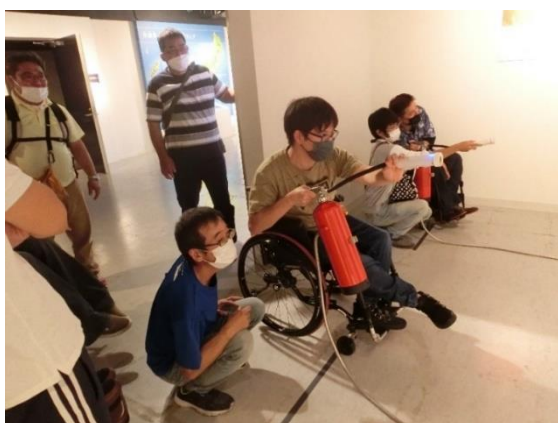
消火器を使って火を消しているところ

消火器を使用するのが久しぶりだったので、緊張してしまいホースの持ち方を間違ってしまった💦 日々の生活の中で、消火器を使う場面に直面したときには、今回のような間違いをしないようにおちついて対処していきたいと思えます！ by ふーぶ